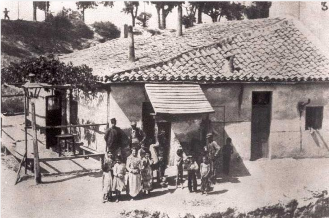
Barrio de las Injurias - Madrid, 1885.